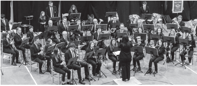
Banda di Berbenno e Buglio